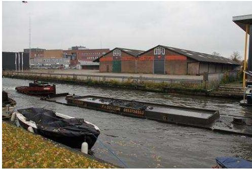
FIGUUR 6: LANGS DE VAARTSCHE RIJN LIGGEN NOG ENKELE VROEGERE LOODSEN EN BEDRIJVEN DIE HERINNEREN AAN DE VROEGERE INDUSTRIE LANGS DIT KANAAL.

2006, p. 18). Steenbakkerijen werden niet in steden geplaatst, vanwege het grote brandgevaar (Fafianie, 2002, p. 32). Overigens zorgde de komst van de stoommachine voor een intensivering van de steenbakkerijen.