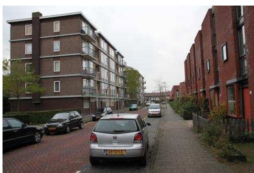
FIGUUR 14: HERSTRUCTUERING IN NIEUW-HOOGRAVEN.

Eind jaren 90 vindt in meerdere vroeg naoorlogse wijken herstructurering plaats (Kamerstukken II 1996-1997, 25 427). Minder huurwoningen en meer koop. Een deel van de flats in de wijk wordt gesloopt om plaats te maken voor normale rijtjeshuizen. De meest recente nieuwbouw vindt plaats op de plek van het winkelcentrum 't Goylaan, waar een geheel nieuw winkelcentrum met daarboven appartementen is verschenen. In het kader van het project "Hart van Hoograven" vinden rondom de 't Goylaan vele