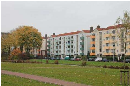
FIGUUR 12: DE FLATS IN NIEUW-HOOGRAVEN HEBBEN VEEL GROEN IN DE OMGEVING.

Na de grote gebiedsannexaties van 1954 door Utrecht werd Hoograven grondgebied van de Domstad. Voor Nieuw-Hoograven, zoals de nieuwbouwlocatie werd genoemd, werd de basis geschapen in het Structuurplan 1954. Hierin werden de nieuwe wijken van Utrecht beschreven, waarbij ook gedacht moet worden Kanaleneiland en Overvecht (Vogelzang, 2005, p. 93; Blijstra, 1969).