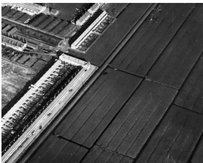
FIGUUR 8: DE HUIZENBLOKKEN IN OUD-HOOGRAVEN HADDEN DEZELFDE BREEDTE ALS HET WEILAND. (HET UTRECHTS ARCHIEF, 1935)

Het was echter de bouw van de vier Lunetten tussen 1822 en 1826, als onderdeel van de Nieuwe Hollandse Waterlinie, die woningbouw in Tolsteeg