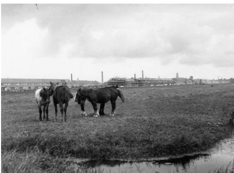
FIGUUR 5: WEILAND WAAR NU NIEUW-HOOGRAVEN LIGT. OP DE ACHTERGROND IS OUD-HOOGRAVEN IN AANBOUW.

Er bestaan aanwijzingen dat rond het begin van de 11 e eeuw de gebieden ten zuiden van de stad Utrecht zijn ontgonnen onder leiding van het bisdom Utrecht (Fafianie, 2002, p. 29). Nadat eeuwenoude vage eigendomsverhoudingen werden verhelderd ten gunste van het bisdom, kon begonnen worden met de ontginning. De bisschop sloot hierbij als “vercoper” overeenkomsten met gegadigde “copers” voor terrein met vastgelegde lengte- en breedtematen. Hierna konden de “copers” hun gebied ontginnen en in gebruik nemen. Elk jaar moest een belasting (tijns) worden afgedragen aan de bisschop (Vogelzang, 2005, p. 17). Enkele verbindingen werden als ontginningsbases gebruikt, waaronder een vroegere Romeinse verbindingsweg. Van daaruit werden de ontginningen uitgevoerd.