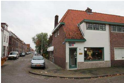
FIGUUR 7: DE OUDSTE BESTAANDE BEWONING VAN HOOGRAVEN, AAN DE HOOGRAVENSEWEG.

Hoewel de huidige wijk Hoograven behoort tot het grondgebied van de Gemeente Utrecht, is dit niet altijd zo geweest. In 1645 verkocht aan Utrecht, werd het gebied in de Bataafs-Franse tijd ondergebracht bij de gemeente Jutphaas (Fafianie, 2002, p.17).