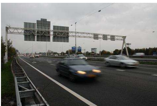
FIGUUR 1: AAN DE ZUIDZIJDE VAN HET ONDERZOEKSGBIED LIGT DE RIIKSWEG 12.

Om in de beperkt geboden tekstlengte een grondig onderzoek te kunnen doen naar een gebied, is het noodzakelijk het onderzoek te vernauwen tot een klein gebied. Er is voor gekozen om onderzoek te doen naar een subwijk in de gemeente Utrecht. Utrecht ligt in het midden van Nederland.