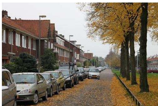
FIGUUR 9: KENMERKEND VOOR DE STRATEN IN OUD-HOOGRAVEN ZIJN DE LANGE BOUWSTROKEN.

1932 komen de Gedeputeerde Staten van de Provincie Utrecht met een uitbreidingsontwerp voor Utrecht. Kortgezegd wordt gesteld dat de polder