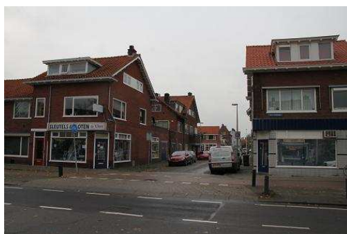
FIGUUR 10: IN TEGENSTELLING TOT NIEUW-HOOGRAVEN ZIJN WINKELRUIMTES DECENTRAAL IN DE KOPWONINGEN GEPLAND, ZOALS HIER OP DE W.A. VULTOSTRAAT.

Hoewel het de bedoeling was om de polder Hoograven direct met deze bebouwing bij de gemeente Utrecht te betrekken, heeft de gemeente Jutphaas dit om financiële redenen tegen weten te houden tot de grote