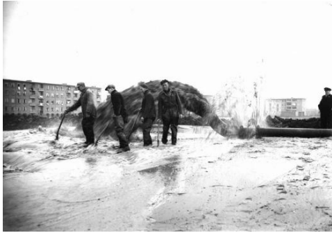
FIGUUR 11: ZANDOPSPUITING TEN BEHOEVEN VAN NIEUW-HOOGRAVEN.

Na de tweede wereldoorlog heerste in Nederland een grote nood aan woningen. Jonge gezinnen moesten bij anderen inwonen of langer bij de ouders blijven. Ook in Utrecht heerste een woningschaarste. In Utrecht was de nood ook aanwezig en de gemeente wilde uitbreiden. Nadat bleek dat de Duitse luchtmacht weinig moeite had de Waterlinies te passeren, verviel in 1951 de Kringenwet. Hierdoor werd het mogelijk de overige delen van Hoograven ook vol te bouwen met woningen.