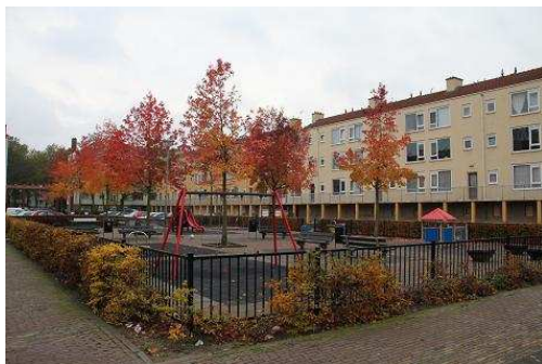
FIGUUR 13: HOVENSTRUCTUUR; IN HET MIDDEN EEN SPEELTUIN.